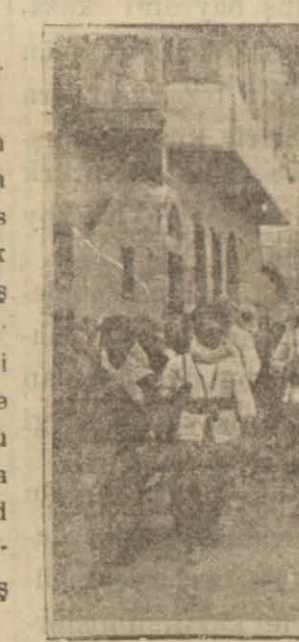
Millî mücadeleye iştirak eden kahramanlarımızdan bir grup

On yedi sene evvel bu günü kezanın kahramanları ve o kahramanların bu günkü evlatları,