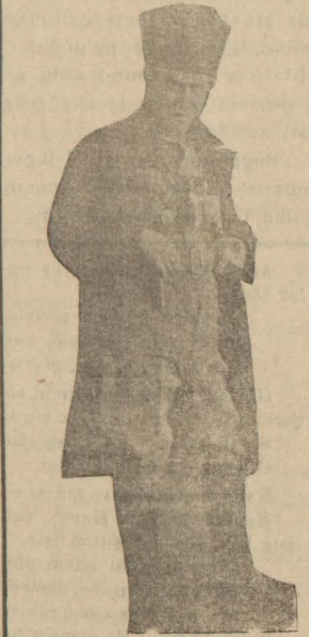
Belediye reisi Mitat Toroğlu

Tören belediye reisi z. Mitat Toroğlunun bir konuşmasıyla başlamıştır. (Tefsiatını yarınki nushamızda yazacağız.)